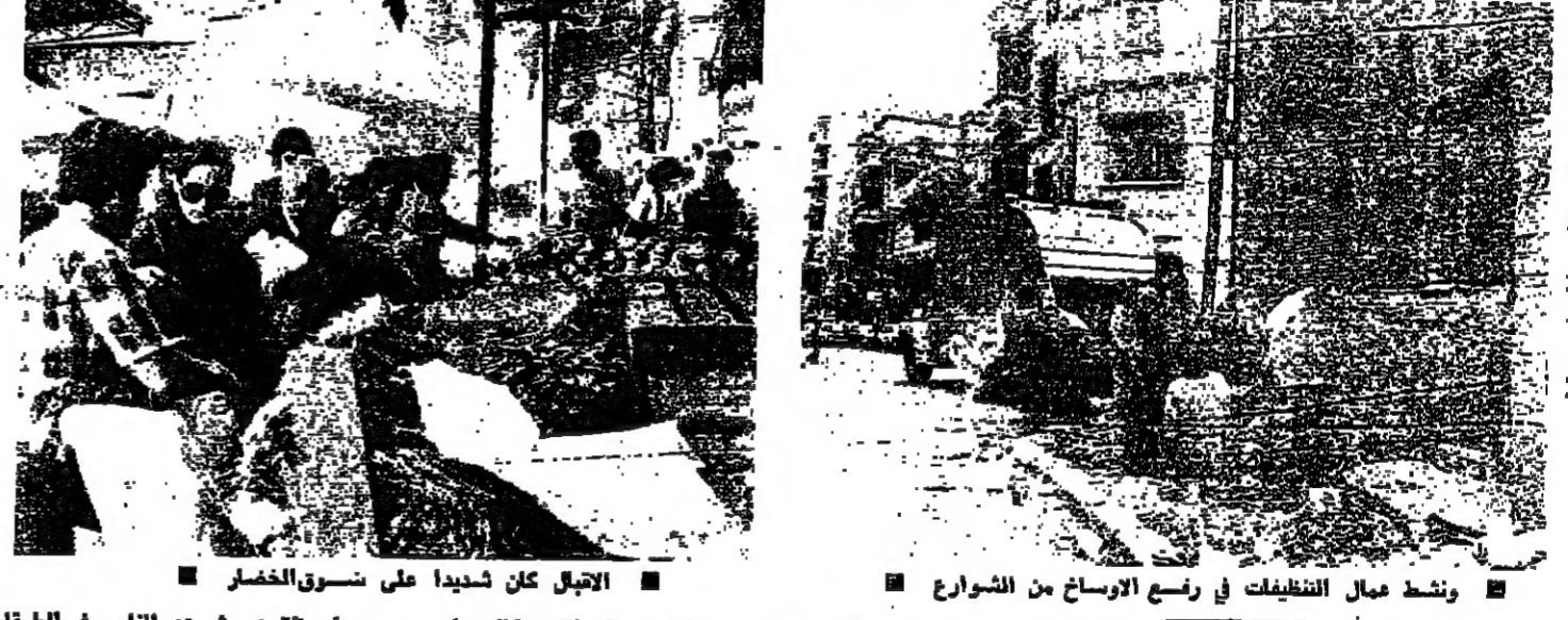
الاجيال كان شديدا على سوق الخضار .. ونشط مجال التنظيفات في ربيع الاسواق من الشوارع

الفاء رحلات الامواج السياحية الى لبنان لكرت اوساط العاملين في القطاع السياحي ان الاحداث الاخيرة قد شلت المؤسسات السياحية ، وان معظم الامواج السياحية الآتية من الغرب قد تلقت رحلتها الى الشعار آخر . وسبق للهيئات العاملة في القطاع السياحي ان اشككت منذ اكثر من اسبوعين ، من انخفاض معدل السياح بشكل كبير نتيجة الاضطرابات التي يشهدها لبنان بين وقت وآخر .